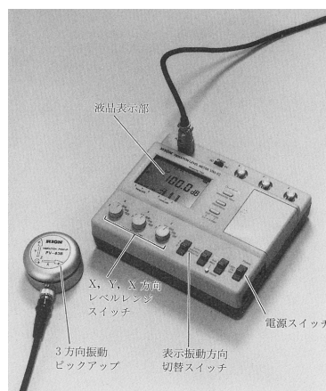
図 振動レベル計と振動ピックアップ