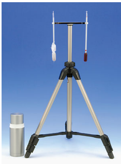
写真 カタ寒暖計 (カタ温度計)