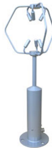
写真 超音波風速計*2