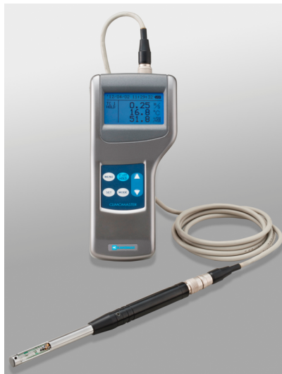
写真 熱線式風速計*1