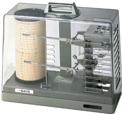
写真 自記式温度計

アスマン通風乾湿温度計 (→仕組みをしっかりと理解する) は、ドイツの気象学者 R. Assmann が 1887 年に考案した。温度計自体は、ガラス製温度計 (ガラス容器に水銀を封入)。湿球温度計の示度は、感温部が水の蒸発により冷やされて乾球温度計の示度よりも低くなる。これらの差を用いて相対湿度を計算する (JIS の表、もしくは Sprung (スプリング) の公式などを用いる)。