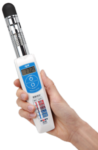
写真 WBGT 計