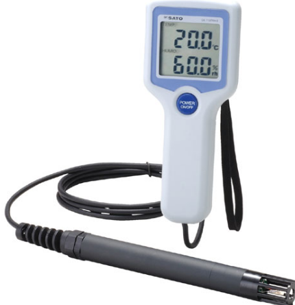
写真 デジタル温湿度計*2