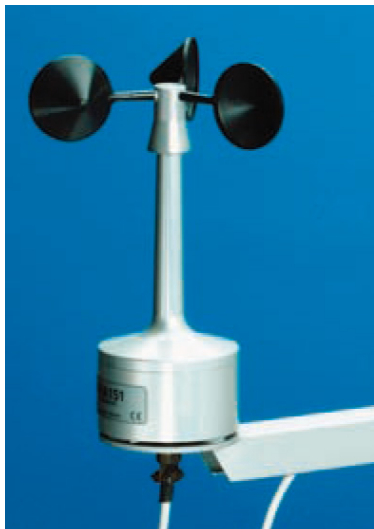
写真 三杯式風速計