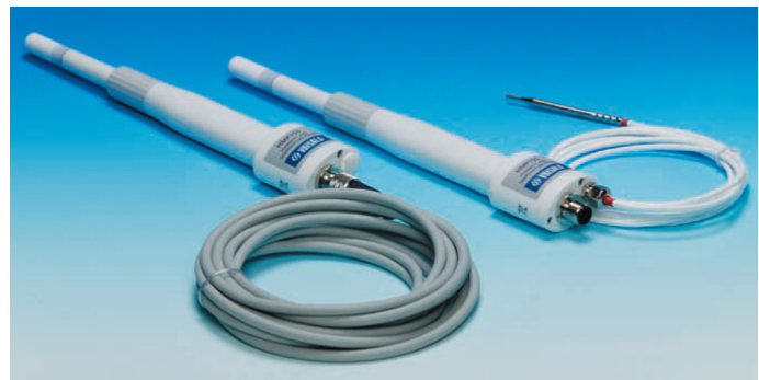
写真 湿度温度プローブ*1