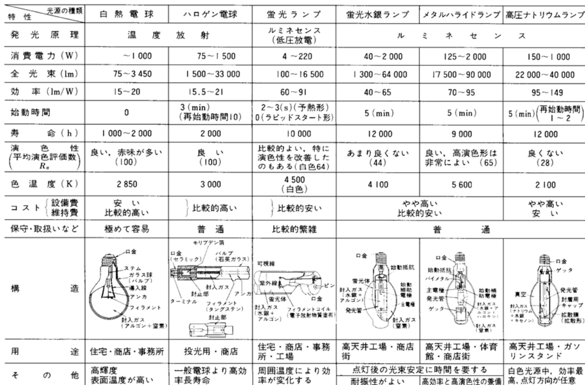
表 主な光源の性能と特徴