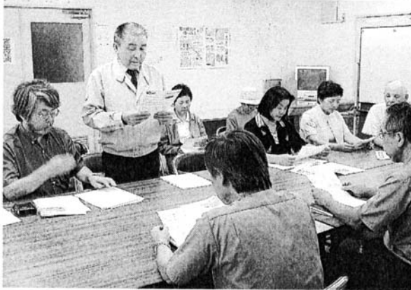
鉄道建設・運輸施設整備支援機構への申し入れ書を 読み上げる住民代表（左から2人目）＝水俣市

九州新幹線（新八代― 鹿児島中央間）の騒音調 査で、熊本県内の沿線住 宅地約二百五十地点の三 割以上が環境省の騒音基 準を超えた問題で、同新 幹線による騒音・振動被 害を訴えている水俣市と 八代市の住民らが五日、 鉄道建設・運輸施設整備 支援機構水俣鉄道建設所 （水俣市）を訪ね、調査 結果公表などを文書で申 し入れた。