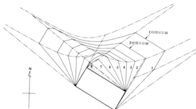
図 日影時間図（出典：参考文献 [4], p. 36)