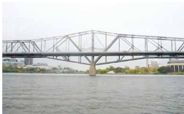
川からの風景。カナダの首都オタワにて。 (2012年に筆者が制作した映画『The Art of Becoming』より)

本学での教育活動を通じて、若いデジタル世代には無限の可能性があり、高度な言語能力および ICT 技能を駆使し、積極的に自己表現を行う地球市民 (global citizens) になっていくと日々確信しています。今後の研究としては、筆者のゼミに所属する学生たちと協力し、熊本をテーマとする日英バイリンガルの映画制作プロジェクトを実施する予定です。このような研究活動により、学生たちが「地域に生き、世界に伸びる」グローバルな人材として、新たな価値観を生み出していくお手伝いできればと願っています。