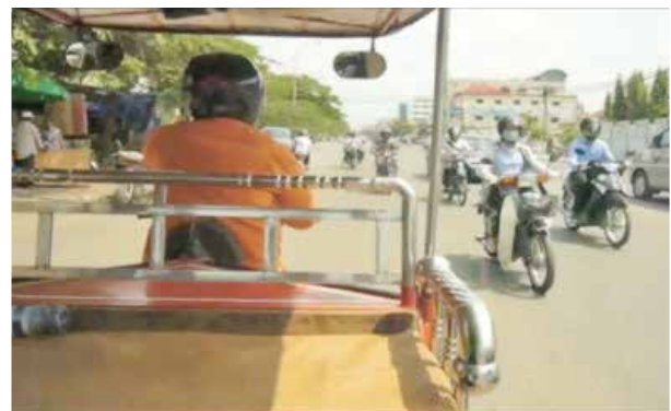
日常の風景。カンボジアの首都プノンペンにて。 (2012年に筆者が制作した映画『The Art of Becoming』より)