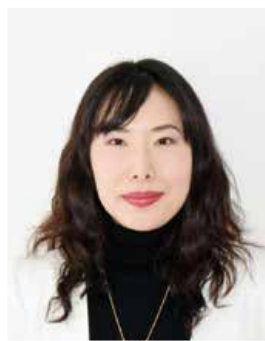
文学部英語英米文学科 講師